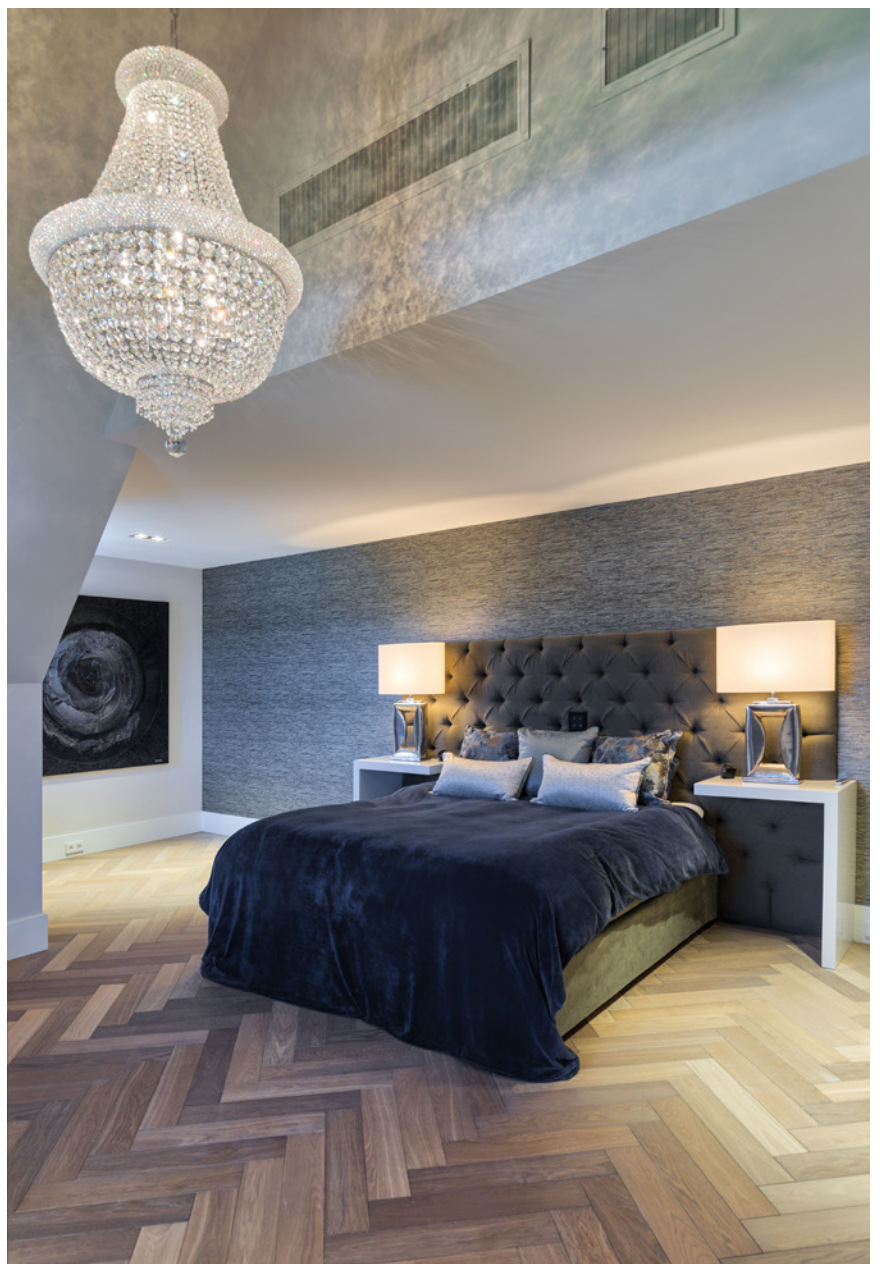
De bewoners genieten dagelijks van de stijlvolle houten vloer van Martijn de Wit Vloeren.

“Om verschillende stijlen en smaken samen te voegen in een passend concept voor beiden, vind ik het meest uitdagende van dit vak”