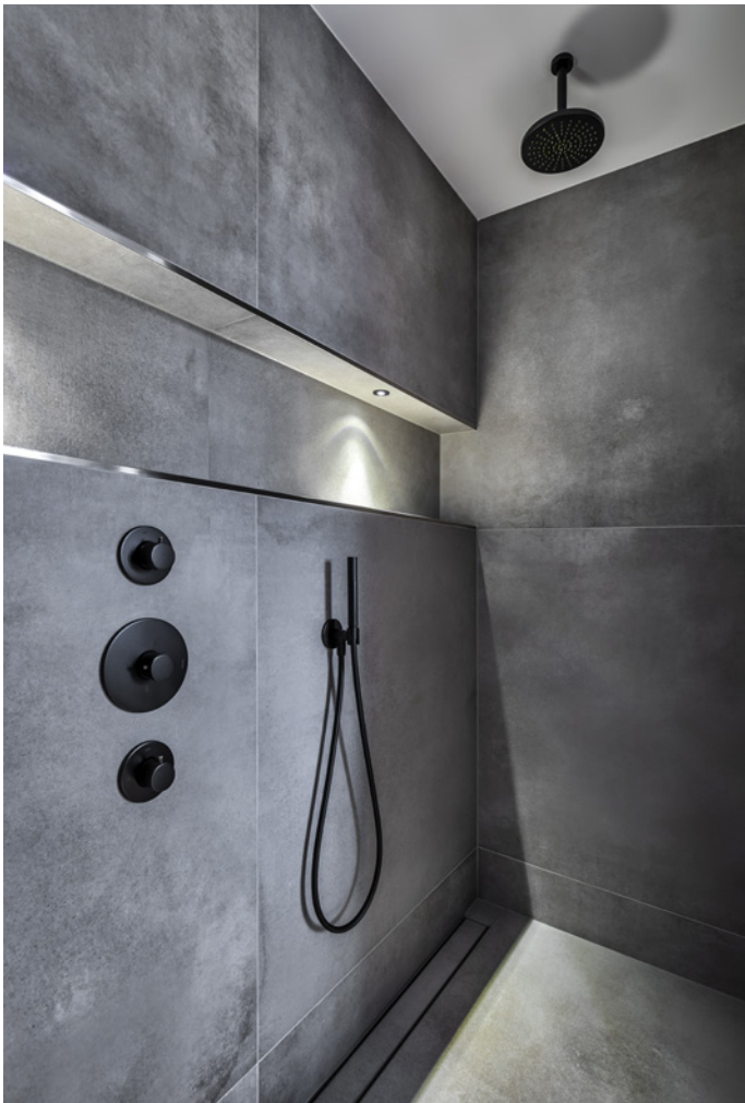
Dankzij de Italiaanse roots van de interieurontwerper kreeg het interieur tot in de details een functioneel en mooi vormgegeven uiterlijk.

“Met name haar ideeën ten aanzien van een aantal ruimtes op de eerste verdieping vielen meteen bij ons in de smaak”