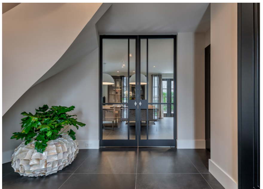
Bod'or leverde de Le Cadre taatsdeuren, de Christian glasdeuren, de Cube kozijnen en de Amsterdam deuren.

Het gebeurt natuurlijk niet iedere dag, dat twee kavels worden gekocht om deze vervolgens samen te voegen tot één perceel en daar een huis op te bouwen. Dus gingen de bewoners om de tafel met de betreffende gemeenteambtenaren en werd een principeverzoek inclusief schetsontwerp ingediend. En uiteindelijk lukte het de bouwkundig ambtenaar om de vergunning af te geven. Het bouwen van het droomhuis kon nu eindelijk beginnen.