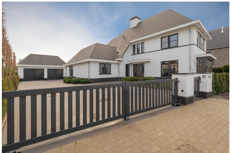
De poort werd geplaatst door DJS Hekwerken.

Wel namen zij zelf plaats in de bouwvergaderingen, zodat ze toch op de hoogte waren van de status en zelf ook oplossingen konden aandragen. Bewoners: “We zijn ontzettend goed