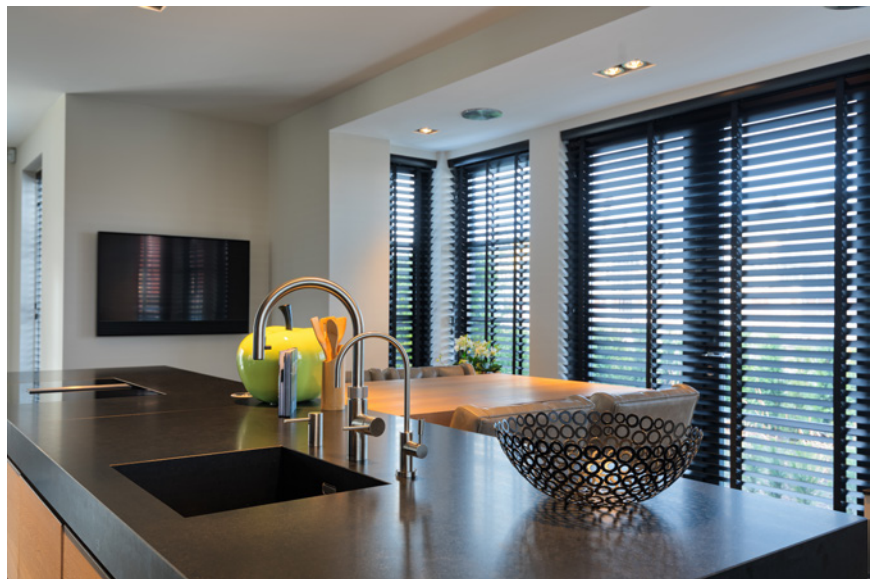
Met keukenapparatuur van Miele en een Quooker kokendwaterkraan is ook deze keuken weer helemaal compleet.

Aan de voorzijde bevindt zich een royale keuken. Deze is geheel op maat gemaakt, net als alle kasten in de woonkamer, badkamer en op de gehele bovenverdieping. Vervolgens zien we een aantal bekende meubelen staan, zoals de stoelen in de dining in het midden van de kamer