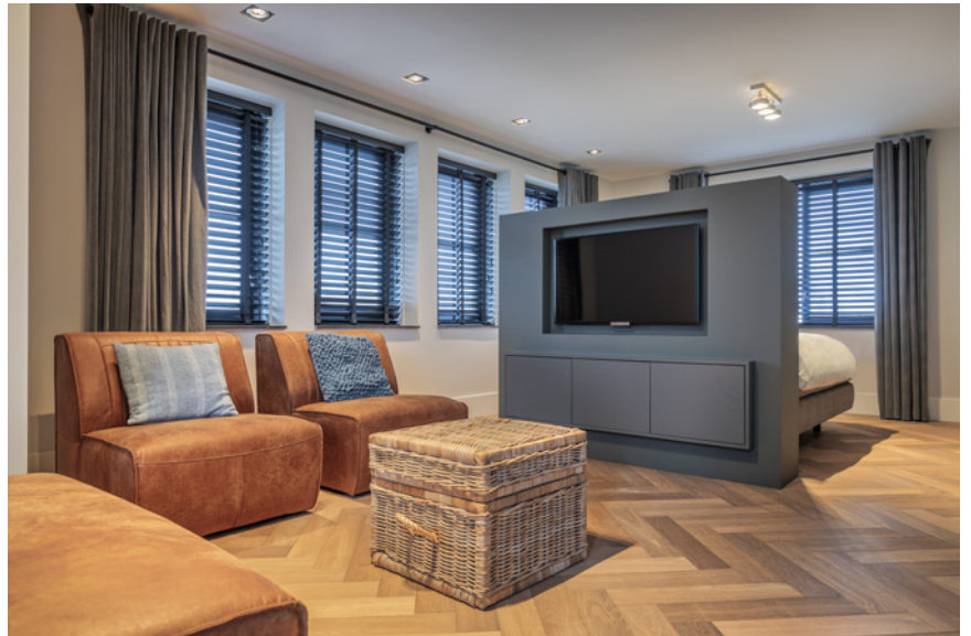
Gordijnen van Atelier Robiflex en jaloezieën van Indivipro maken de warme sfeer compleet.

Tekst: Mascha Ekkel