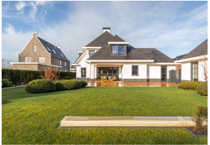
De tuin werd ontworpen door Arie Tuinarchitectuur en aangelegd door Geerlings Tuinen.