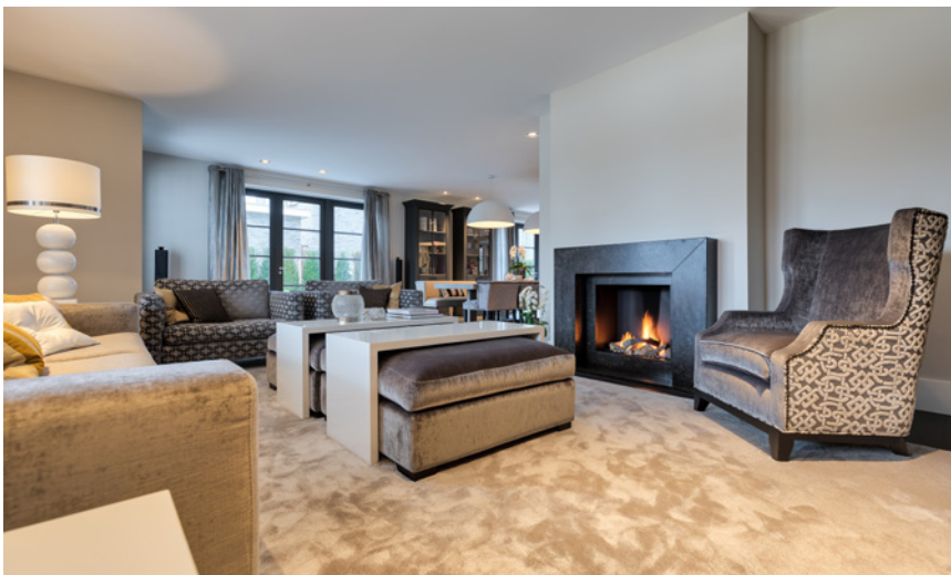
Keijser & Co leverde de elegante meubels voor deze woning.

“In de woonkamer heeft het interieur een warme en stijlvolle aankleding”