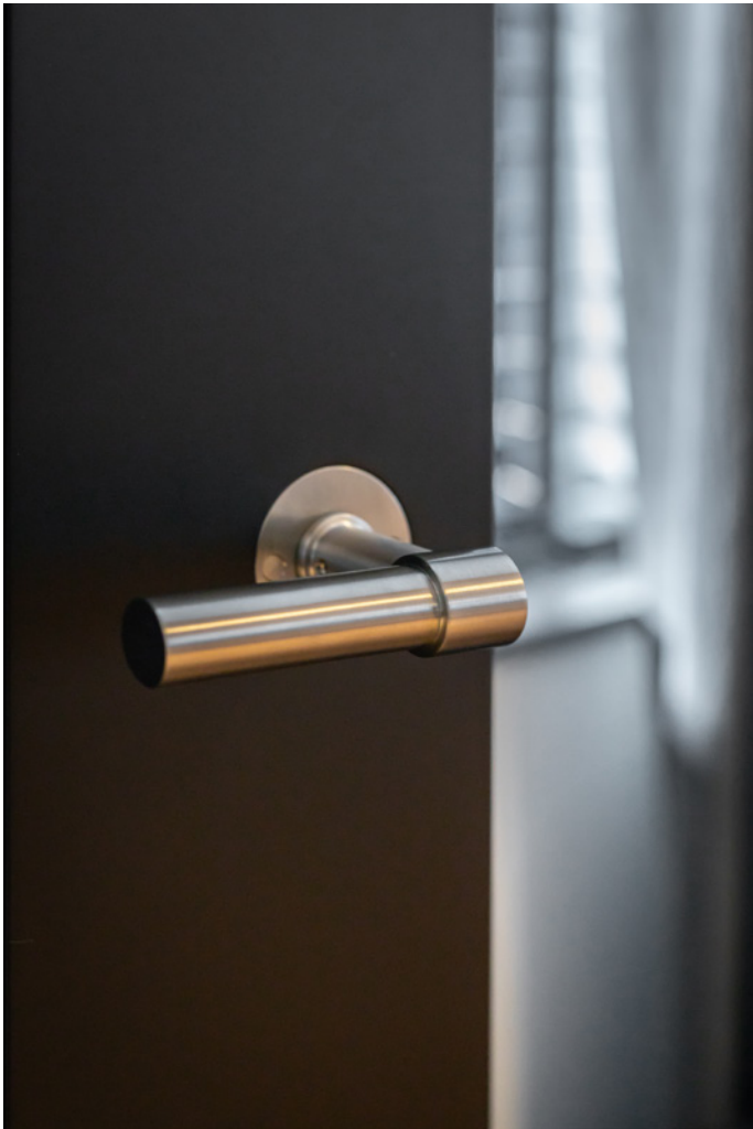
Het deurbeslag is uit de collectie Piet Boon van Formani.

en in de living aan de achterzijde van de woning. Deze zijn afkomstig van het toonaangevende inspiratiecentrum ETC Design Center Europe in Culemborg. Ook de groenaccessoires, de gordijnen en enkele kunstwerken komen bij ETC Design Center Europe vandaan.