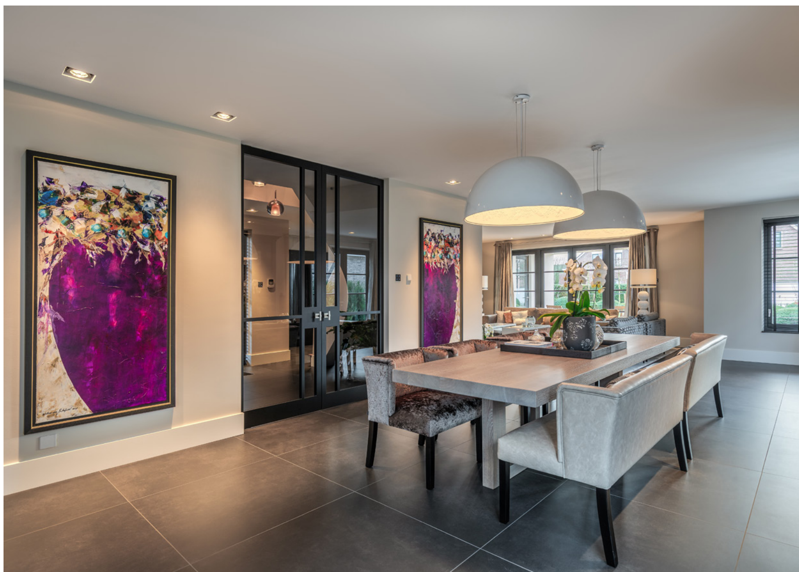
De elektrische installatie, domotica, beveiliging en de verlichting werden geïnstalleerd door Homma Elektrotechniek. De verlichting is afkomstig van Edisons Verlichting. De Airspots zijn verlichting en ventilatie ineen.