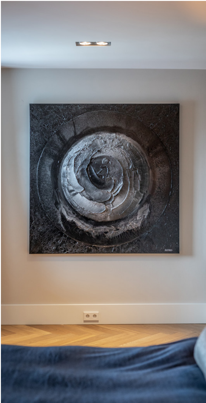
Het schilderij Black circle van kunstenaar Jan Kind werd geleverd door Umo Art Gallery.