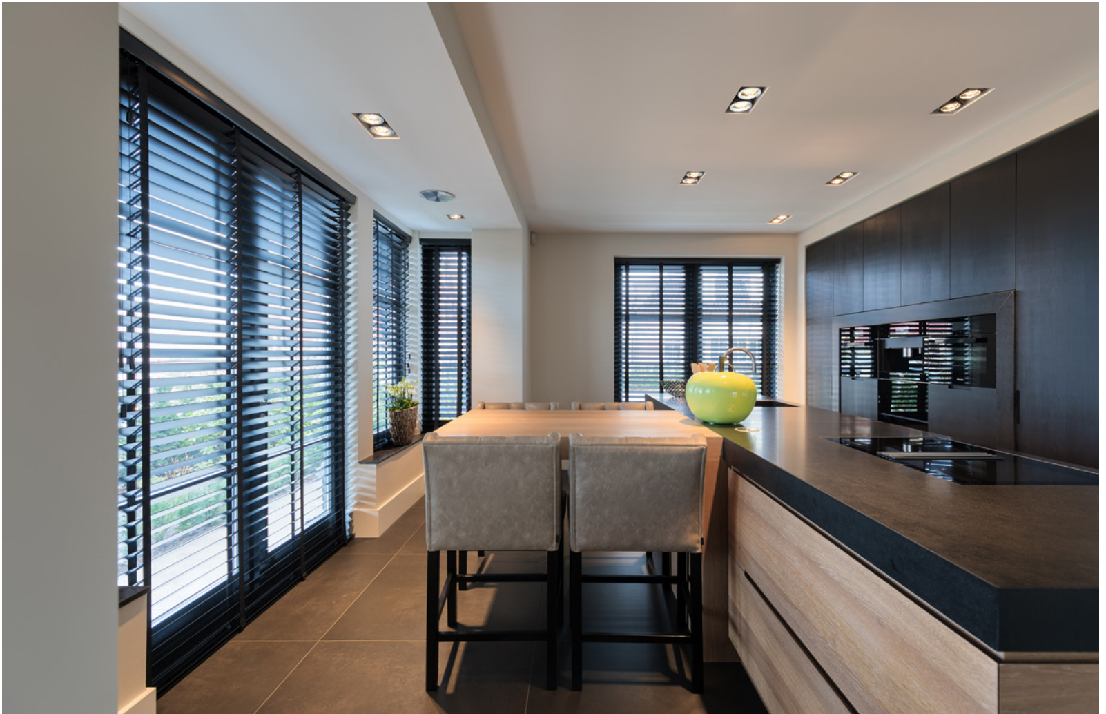
Kuivenhoven keukens maakte niet alleen de keuken op maat, maar ook het maatwerkmeubilair en de inrichting van de kleedkamer en het kantoor.

taatsdeuren geven de bezoeker meteen al meer verwachtingen. En die worden ook waargemaakt, want wanneer we de woonkamer betreden, zijn we niet alleen onder de indruk van de enorme ruimte, maar ook van de warme, stijlvolle aankleding van het interieur. In het kleurenpalet zien we de Italiaanse touch van Daniela: chique, duurzame kleurtonen in zwart, grijs en taupe, afgewisseld met wat accentkleuren zoals goud en okergeel.