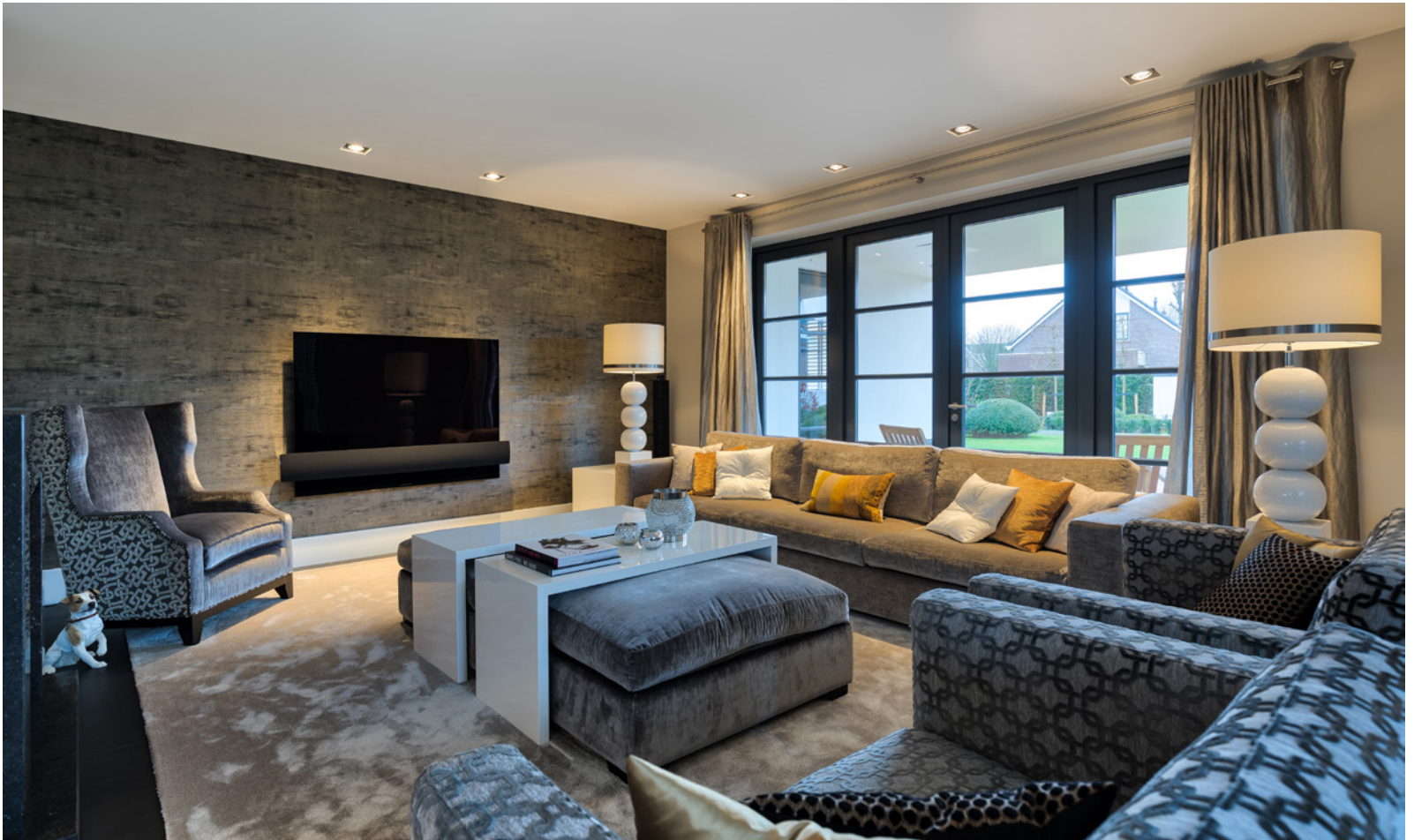
Bang & Olufsen Brussee leverde de tv schermen, luidsprekers voor binnen en buiten, de Matrix oplossingen en dat alles op één BeoRemote. Daarnaast zorgden zij voor professioneel wifi en internet.