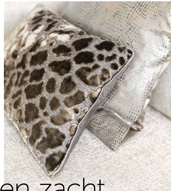
Alles geleverd door Daniela Cupello Interior Design.